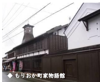
◆ もりおか町家物語館