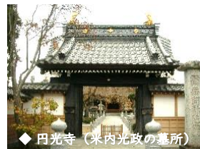
◆ 円光寺（米内光政の墓所）