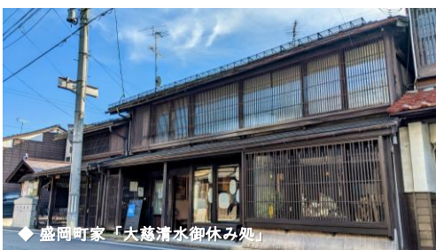
◆ 盛岡町家「大慈清水御休み処」

明治34年頃建築。平成19年に盛岡まち並み塾により地域の活動拠点として借上げ改修活用した第一号町家。まちな家内所、町家見学、改修相談窓口、喫茶、レンタルスペースとして各種利用可能。営業時間10時～16時／水曜定休。