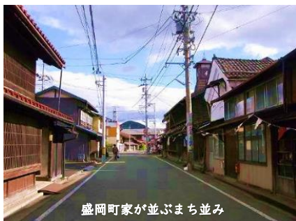
盛岡町家が並ぶまち並み

盛岡町家は「こみせ」の内土間化した柱持ち下屋を持ち、平入りの町並み。平入りは北東北では旧南部領に分布。町人の職住一体の居住形式で、表から裏に通る土間「ろーじ」が通り、母屋、坪庭、蔵が基本。常居「じょい」の吹抜けが特徴。