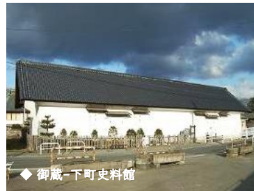
◆ 御蔵・下町史料館

江戸「近藤」～大正「浜藤」酒蔵・旧岩手川工場を活用した町家の見学施設。ホールの利用が可能。営業時間9時～19時／毎月第4火曜定休。