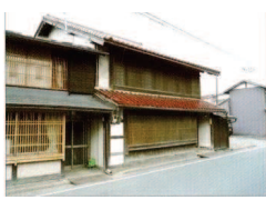
⑬ 大形家町家/「吉重」町家

明治期の町家。野鍛冶として創業し、現役の鍛冶屋。見せ部分を作業場として、2階まで吹き抜けて、煙出しが正面に付く町家。隣家も同時期の町家。 ■イベント参加時以外は非公開