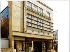
⑲ 鎌田薬局・鎌田家町家

明治 5 年創業の村井酒造店の創業時の酒蔵。現在は昭和蔵で製造し、限定酒、地場産品の販売、試飲ができる「地酒物産館」を併設している。また無料で工場見学ができる。 ■定休日 TEL:019-652-3111 「地酒物産館」TEL:019-624-7200