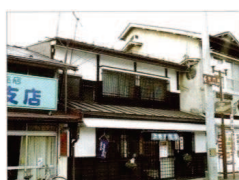
⑧ 上野豆腐店・上野家町家

天保 5 年(1834)棟札。市内で判明している町家で最も古い大型の町家。角にうだつを持ち、江戸期の造りが残る町家。近年、修理された。県指定文化財。 ■非公開(平日、事前申込) TEL:019-623-1251