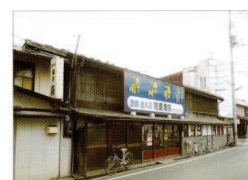
⑩ 細重酒店・細川家町家

明治 17 年の大火後に再建された町家。元は惣門番人。再建時は杉土手の小川木材材所の屋宅。相当老朽化していたが、修理して蘇った町家。 ■非公開