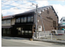
㉒ 松田屋・松田家町家

明治期の町家。元は問屋業の大店で、市内最大級の町家。右側に土蔵造りの塀が回る実質入口をもつ。明治期の桜の名所吉萬公園(南大通近辺)を提供していた。 ■非公開