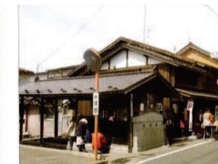
⑥ 大慈清水(共同井戸)

江戸期は湧水で、明治以降道路向けの弥陀寺の境内から木管で引水。昭和 45 年頃に井戸に変わっている。寺の青龍伝説から名づけられた。現在は早朝に、地域住人により清掃され大切に管理されている。 ■常時