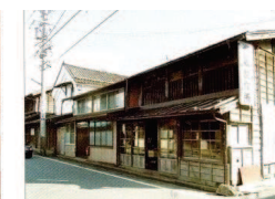
⑫ 斎坂製作所・斎坂家町家

明治期の町家。酒造店の町家で、戦後農機具販売をし、現在は住まい専用。表側だけ塗装塗りした町家。 ■イベント参加時以外は非公開