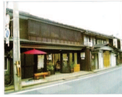
③ 喫茶ピッピー・吉田家町家

明治期の町家。吉田倉政治創建。屋号「八百倉」の八百屋。平成20年にモデル町家改修として修理・活用工事を行う。 ■非公開