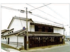
⑦ 木津屋本店・池田野家町家

天保 5 年(1834)棟札。市内で判明している町家で最も古い大型の町家。角にうだつを持ち、江戸期の造りが残る町家。近年、修理された。県指定文化財。 ■非公開(平日、事前申込) TEL:019-623-1251