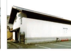
⑱ 源三屋・あき開工場

明治初期まで市内随一の「近藤」から「浜藤」が取得し、大正期に酒造りを復活。現在は市が改修し拠点施設として取得して保存活用。隣は新築修景された望楼付消防新番屋。 ■常時 ※定休日第 4 火曜 他 TEL:019-654-2911