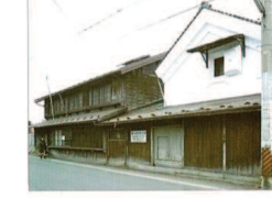
⑰ もりおか町家物語館

明治 20 年に築川村から転居するためにこの地区の諸土屋敷に準じて建築された。中央玄関から右側に客座敷、左側に家内用座敷、台所等をもつ、唯一の武家の遺構です。 ■イベント参加時以外は非公開